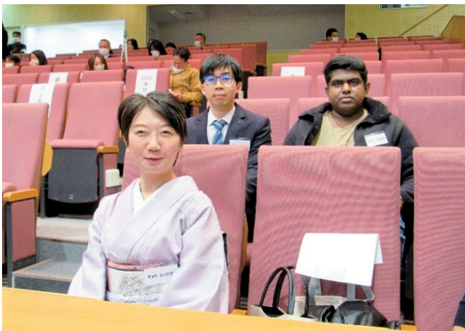
チョウ ショウブン 私が感じた和の魅力 チャン メンル 小さなきっかけ シシタ バラスリヤ 技術を学ぶための英語の重要性