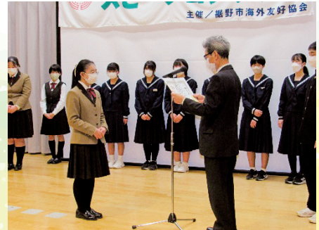
二ノ宮海外友好協会会長より表彰を受ける受賞者