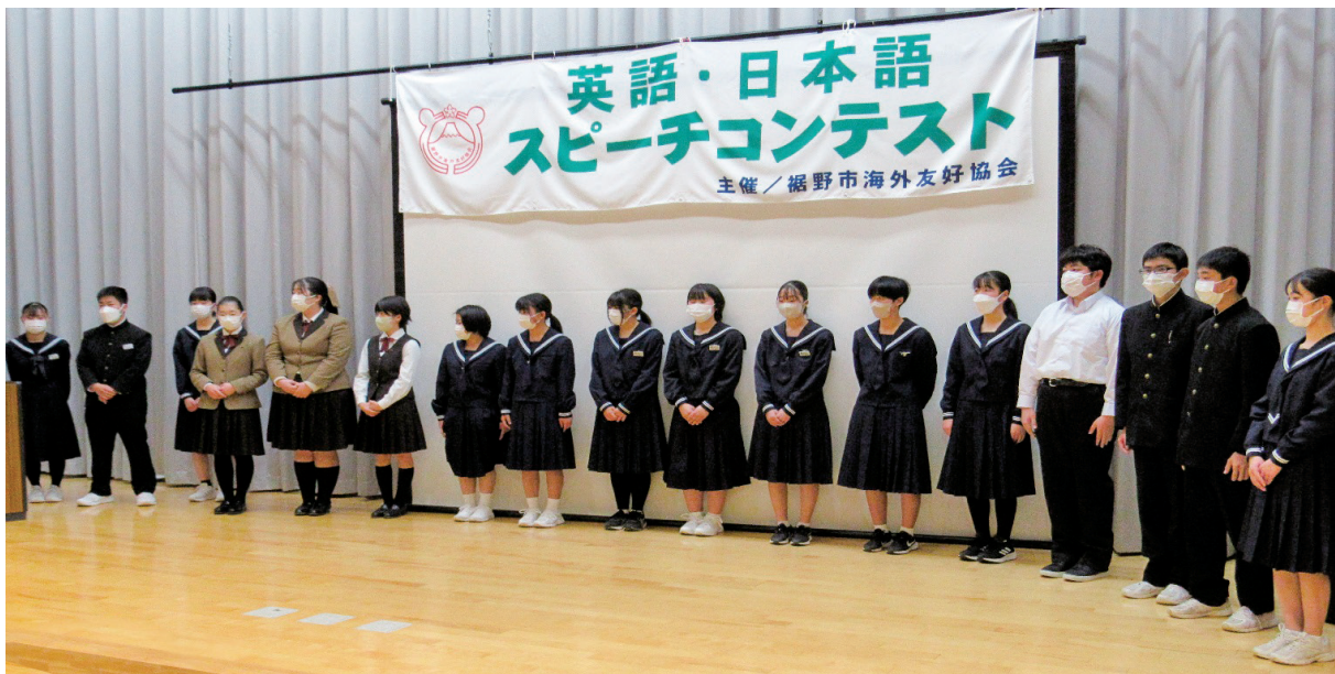
英語スピーチコンテストに参加した、市内6中学校の生徒の皆さん

2月11日に恒例の第40回英語スピーチコンテスト・日本語スピーチが生涯学習センターにて開催されました。英語部門では市内中学校2年生の生徒17人と日本語部門では3人の外国人の皆さんが参加しました。