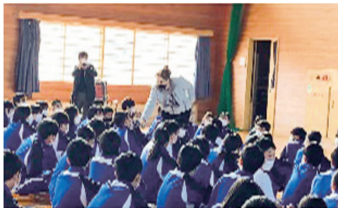
生徒からの質問を受ける講師