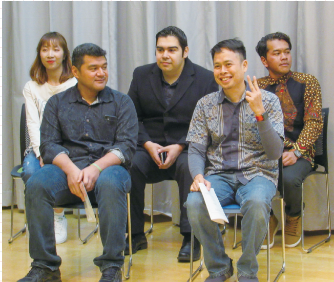
【日本語スピーチに参加した各国の皆さん】