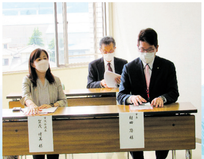
(総会に出席の来賓 左から賀茂市議会議長、風間教育長、村田市長の皆様)

しかしながら、コロナの影響でフランクストン訪問団が来日できず、やむなくズームによる記念式典の開催となりました。